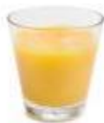
2 dl täysmehua tai tuoremehua